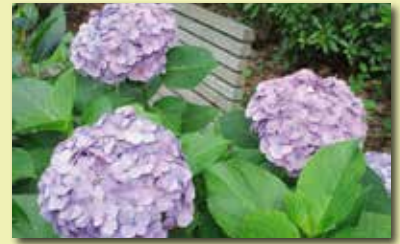
行田公園（船橋市）に咲く紫陽花