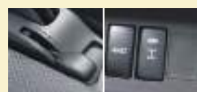
Hi-Loモード切替レバー デフロックスイッチ

悪路でもタフに走れる、 優れた4WD性能。 MT車は、悪路などではより強いトルク を引き出せるLoモード、市街地ではよ り燃費のいいHiモードに切替えて可 します。ぬかるみからの脱出を助けるデ フロックも標準装備しています。