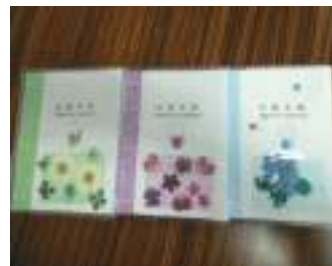
色とりどりのお薬手帳

野田地区女性部は4月20日、野田地区経済センター会議室で、第34期女性短期大学の開校式と第1回講座を行い、23名が参加しました。