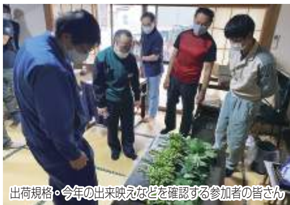
出荷規格・今年の出来映えなどを確認する参加者の皆さん