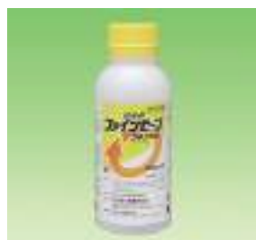
販売規格：500ml 発売元：日本化薬株式会社