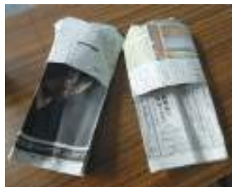
作成した新聞紙スリッパ