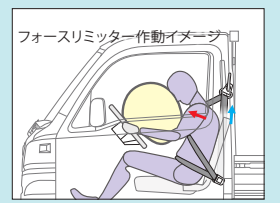
プリテンショナー&フォースリミッター付シートベルト

運転席SRSエアバッグとABSを 全車に標準装備。 プリテンショナー&フォースリミッター付シ ートベルトとの組み合わせで胸や顔への衝撃 を緩和する「運転席SRSエアバッグ」と、タイ ヤのロックを防ぐ「ABS」を標準装備。さら に、「助手席SRSエアバッグ」もメーカー装 着オプションでご用意しています。