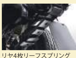
リヤ4枚リーフスプリング

重荷時も安心の、頼れる足腰。 リヤ4枚リーフスプリングの採用により、 重荷を積んだ際の車両後方の沈みを 抑えて安定感のある走りを実現します。 またタイヤには、12インチタイヤを 採用しています。