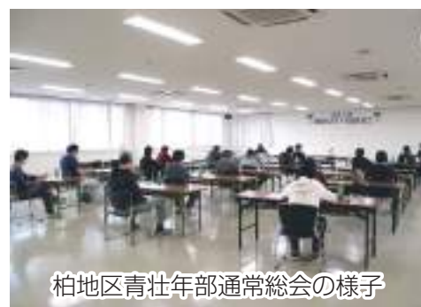
柏地区青壮年部通常総会の様子

総会では、役員改選承認を含む3議案が承認され、以下の皆さんが新本部役員に選任されました。