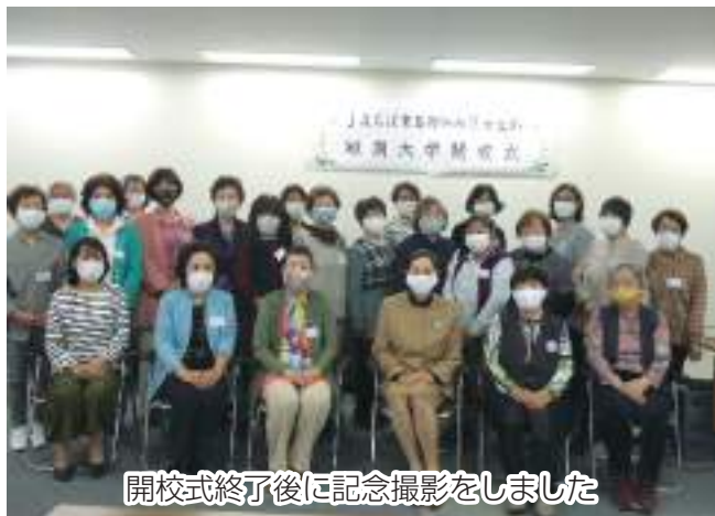
開校式終了後に記念撮影をしました