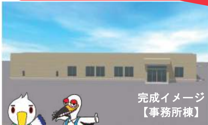
完成イメージ 【事務所棟】