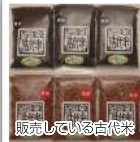
販売している古代米