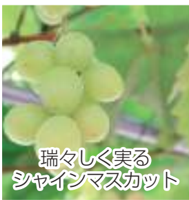
瑞々しく実る シャインマスカット