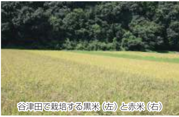
谷津田で栽培する黒米(左)と赤米(右)