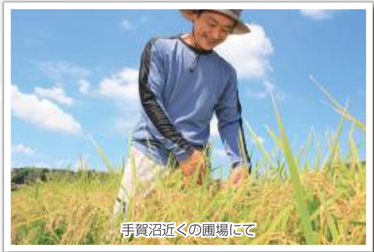
手賀沼近くの圃場にて