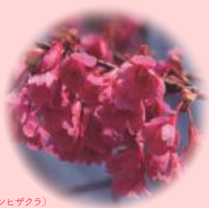
❁ 寒緋桜 (カンヒザクラ) 半野生。沖縄県では1月から咲く