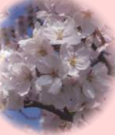
❁ 染井吉野 (ソメイヨシノ) 最も知られている 代表的な品種

庶民の間に夜桜観賞が広がったのは江戸時代になってから。流行の背景には、ろうそくの普及が大きかったようです。ろうそくは奈良時代に中国から伝わっていましたが、非常に高価でした。やがて江戸時代に入るとろうそく的大量生産が可能になり、夜になっても大勢の人が桜を楽しむことができるようになりました。