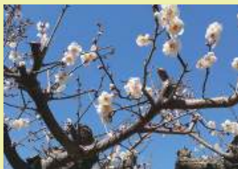
春の訪れを感じる梅の花