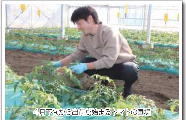
4月下旬から出荷が始まるトマトの圃場