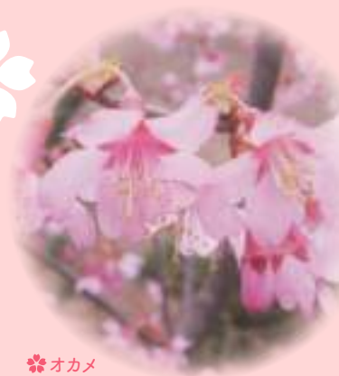
オカメ 英国で作出された桜

「さくら」という言葉の語源をさかのぼると「さ」は穀霊(田んぼの神様)を、「くら」は神様や霊などが宿る場を指し、「さくら」はその両方を合わせたものといわれています。