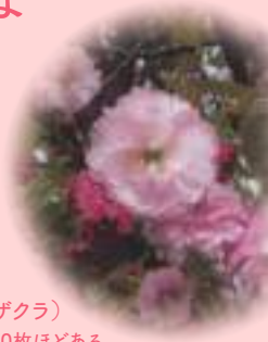
鶯桜(ヒヨドリザクラ) 大輪で花弁が600枚ほどある

分類方法の違いもあり正確には数え切れませんが、日本には野生種・栽培品種を合わせて現在約600種類の桜があるといわれています。古くから園芸品種の育成も盛んですが、元をたどれば10、11種の基本野生種から生まれています。