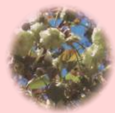
❁ 園里黄桜 (ソノサキザクラ) 黄緑色の花が特徴的