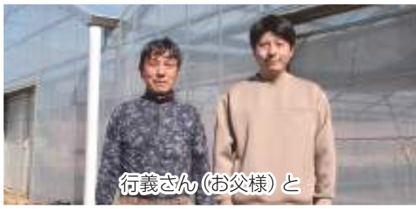
行義さん(お父様)と