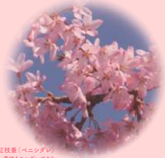
❁ 紅枝垂 (ベニシダレ) 一重咲きのシダレザクラ