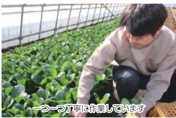
一つ一つ丁寧に作業しています