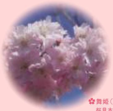
❁ 舞姫 (マイヒメ) 桜見本園で作出された新品種