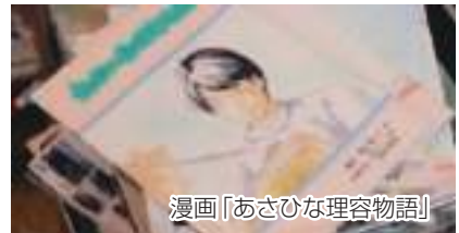
漫画「あさひな理容物語」

【住 所】 柏市あけぼの5-1-2 【電話番号】 04-7145-3327 【定休日】 月曜日・火曜日 【営業時間】 9:00 ~ 19:00