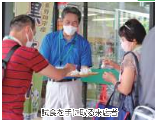
試食を手にする来店者

また、当日は1,300円以上お買い上げいただいたお客様を対象に抽選会も開催。特賞や各賞様々な賞品を用意し、大変賑わいました。