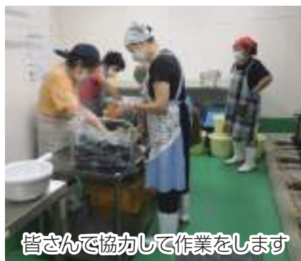
皆さんで協力して作業をします

野田地区女性部は8月1日から9月28日にかけて、同地区多目的ホール調理室で計40名が約235kgの味噌の天地返しを行いました。毎年、女性部では味噌づくりを行っていますが、風味や硬さはその年によって様々。今年は暑い気候のせいか、少し硬めに仕上がった方が多いようです。