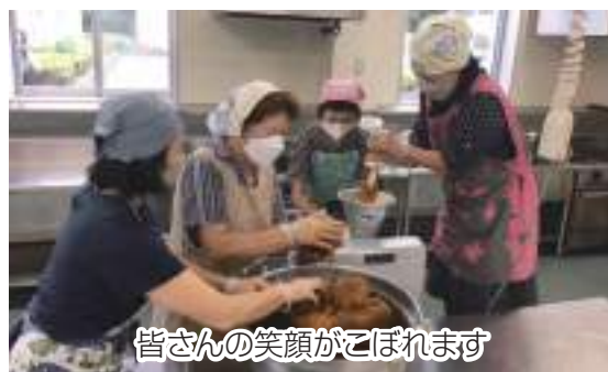
皆さんの笑顔がこぼれます

参加者からは、「今年も美味しい味噌ができました」「炊き立てご飯のおにぎりに付けると最高に美味しい」と完成を楽しみにする声が聞かれました。