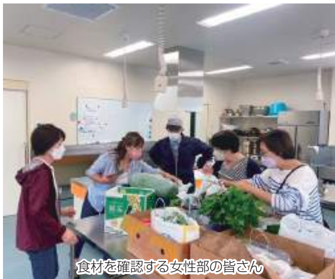
食材を確認する女性部の皆さん

西船地区女性部は9月24日、船橋市の「夏見のおうち子ども食堂」へ食材の寄付を行いました。部員の皆さんが持ち寄った野菜やお米、味噌や保存食など様々な食材が集まりました。