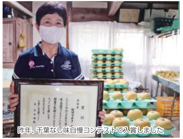
昨年、千葉なし味自慢コンテストで入賞しました