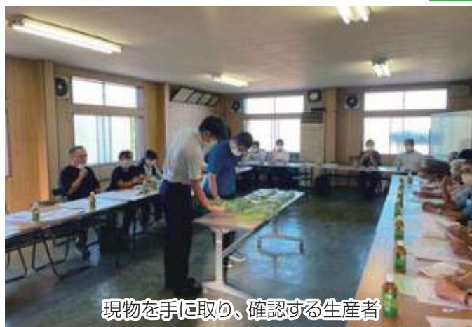
現物を手に取り、確認する生産者

その後、現品査定をしながら規格や出荷に際しての注意点と、適正な農薬使用についての確認を行いました。