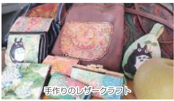
手作りのレザークラフト