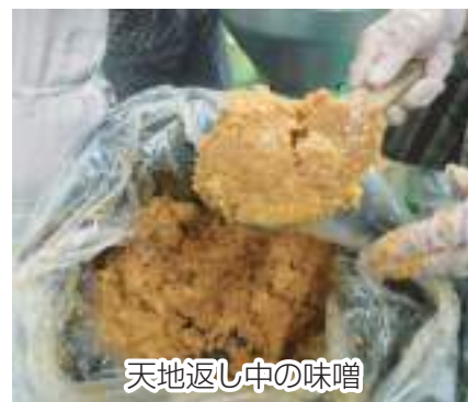
天地返し中の味噌

参加者からは、「協力して作業することが楽しい」といった声が聞かれました。今年度の味噌の出来上がりが楽しみです。