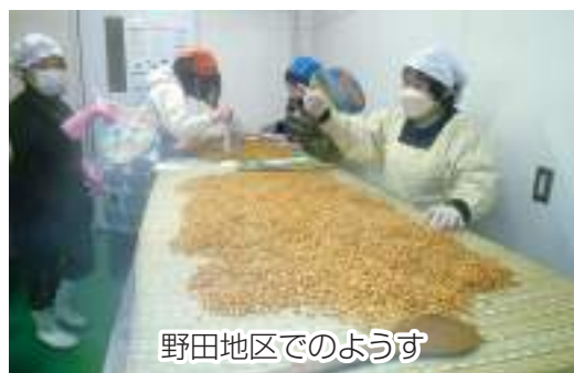
野田地区でのようす