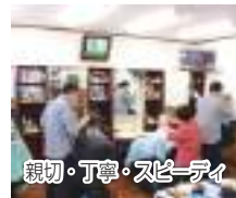
親切・丁寧・スピーディ