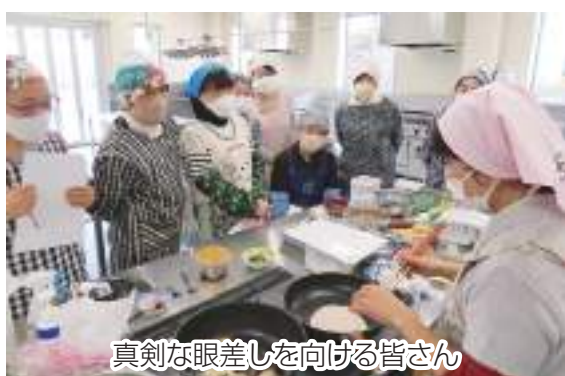
真剣な眼差しを向ける皆さん

女の子の健やかな成長を祈る桃の節句を前に、西船地区女性部は2月17日、西船地区多目的ホール調理室で第6回女性大学講座「雛祭り料理」を開催し、10名が参加しました。