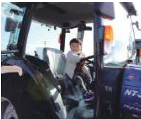
小さなお子さんも安心の展示会

当JAでは引き続き、生産性の向上や省力化、低コスト生産に繋がる提案など、生産者の皆さんの営農活動を支援してまいります。