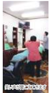
充実の待合スペース