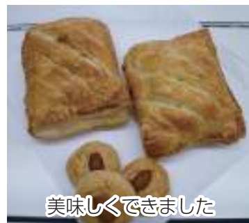
美味しくできました

参加した方からは「久しぶりの料理教室で嬉しい」との声が聞かれ、楽しく賑やかな時間を楽しんでいました。