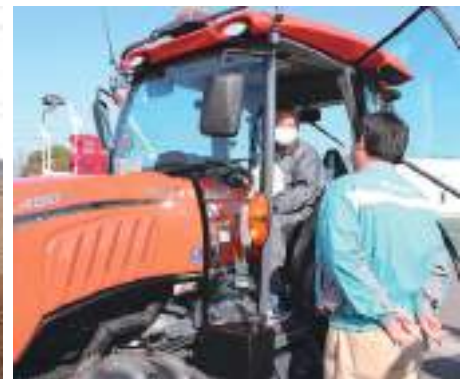
メーカーが直接対応