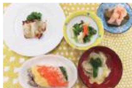
綺麗に盛り付けました

皆さん色鮮やかな料理を前に「みんなで試食ができるようになって楽しかった。花桜は桜餅をお花の形にしたもので可愛い。自宅でも作りたい。」と話も弾みました。