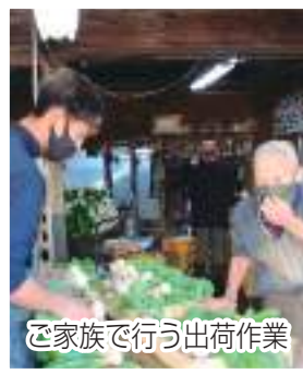
ご家族で行う出荷作業