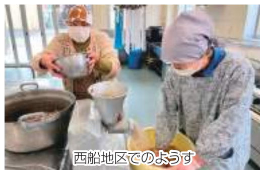
西船地区でのようす

西船地区多目的ホール調理室で1月中旬から2月中旬にかけて行われた味噌作りは、計49名の方が参加し、グループごとに分かれて58樽（約1,160kg）を仕込みました。