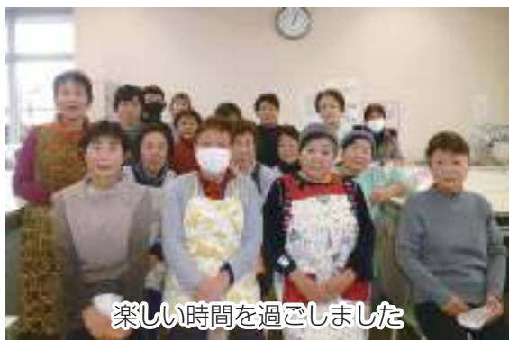
楽しい時間を過ごしました

野田地区女性部うめさと支部は1月27日、南部梅郷公民館で料理教室を開催しました。