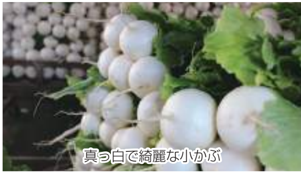
真っ白で綺麗な小かぶ