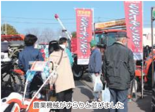
農業機械がすらりと並びました

当JAと県北西JA広域農機センターは2月4日、野田地区経済センターで「農業機械展示会」を開催し、多くの方にご来場いただきました。