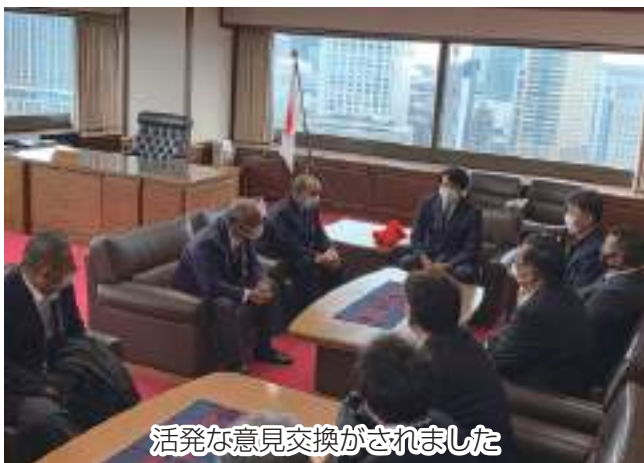
活発な意見交換がされました

野田市内の野田市東部営農組合・農事組合法人小山営農組合・(株)野田自然共生ファーム・農事組合法人きまがせからなるJAちば東葛大規模営農組織協議会は1月23日、意見交換のため法務省を訪ねました。