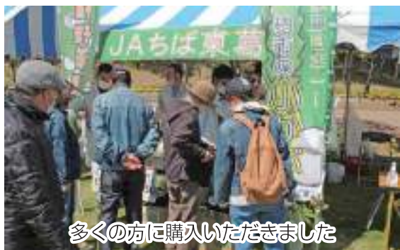
多くの方に購入いただきました

JAは4月9日、柏市布施のあけぼの山農業公園で開催された「チューリップフェスティバル」に初参加しました。