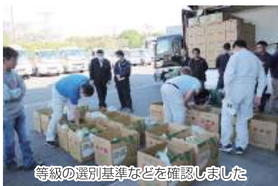
等級の選別基準などを確認しました

JAちば東葛柏小かぶ共撰部会は4月10日、春小かぶの共撰出荷開始を前に、規格統一の意識を高めるため、柏集出荷場で目揃え会を行いました。