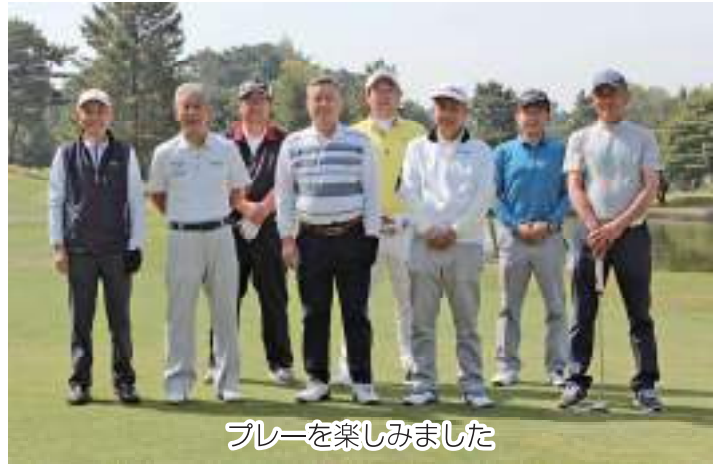
プレーを楽しみました

コロナによる需要の停滞から始まり物価や原材料の高騰など、酪農をめぐる情勢も厳しい最中ではありますが、それぞれ情報交換をしながら約10年振りとなる親睦ゴルフ大会を楽しみました。