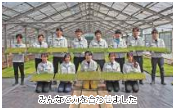
みんなで力を合わせました

新入職員13名は4月上旬から中旬にかけての4日間、新人職員研修の一環である水稻の育苗作業を育苗センター（野田市目吹）で行いました。