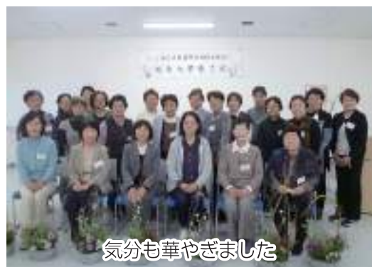
気分も華やきました

野田地区女性部は3月23日、野田地区多目的ホールで短期大学第6回講座を行い、22名が参加しました。