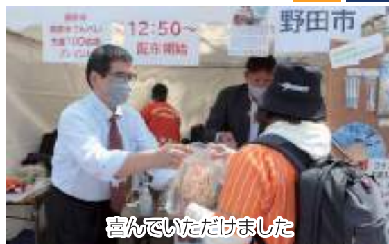
喜んでいただけました

競技場周辺に設けられた特設ブースで、両職員が黒酢米300gと黒酢米せんべい1袋がセットになった野田市PRグッズを先着100名に配布しました。また、ブース内ではコウノトリグッズも販売。購入者にも同様の野田市PRグッズをプレゼントする企画を行いました。