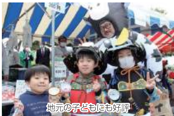
地元の子どもにも好評

桜のピークを迎えた4月2日、野田北部地区運営委員会と関宿ミルクファーマーズは「野田市関宿城さくらまつり」に出店し、職員を含む14名が参加しました。