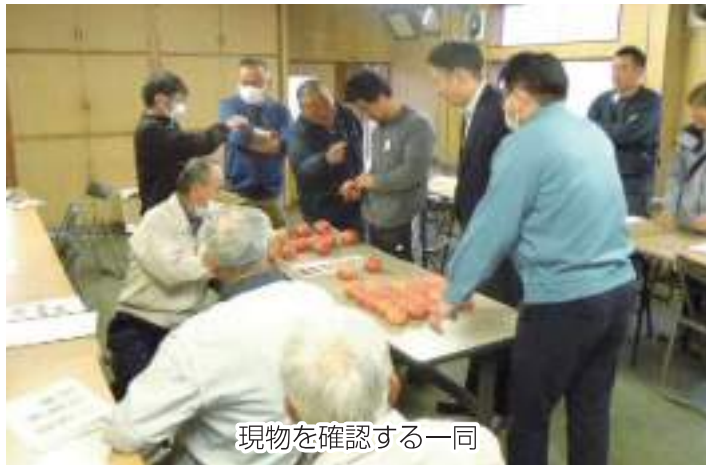
現物を確認する一同

JAちば東葛蔬菜組合岡田支部は4月18日、集出荷場でトマトの出荷査定会を行いました。