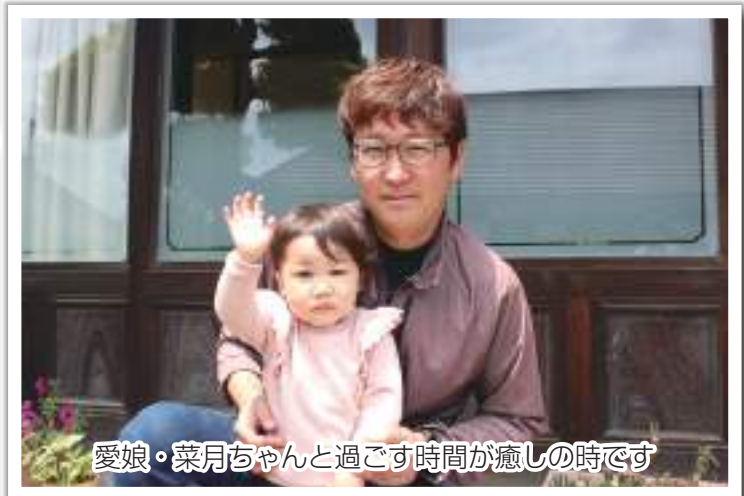
愛娘・菜月ちゃんと過ごす時間が癒しの時です