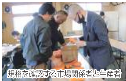
規格を確認する市場関係者と生産者

蔬菜組合岡田支部は5月9日、人参の出荷査定会を同支部集出荷場で行い、東葛飾農業事務所などを含む20名が参加しました。