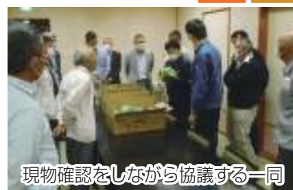
現物確認をしながら協議する一同

木間ヶ瀬大山出荷組合は5月9日、4月下旬から本番を迎えた春キャベツの出荷査定会を野田市内で行い、生産者や市場関係者など18名が参加しました。市場の情勢や圃場管理の注意点などの情報共有を行ったあと、現品査定に入り、規格の確認を行いました。