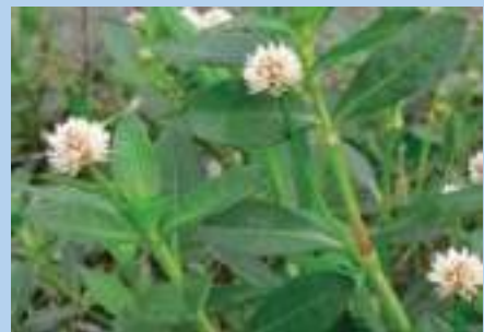
図1：草姿 群落状に固まって生育する

未侵入の水田では水口に網を設置し、茎葉の流入を防ぎます。 農機に付着して拡散するので、 発生していない水田から耕うんし、良く洗浄しましょう。