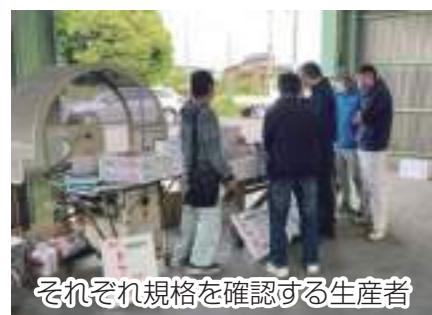
それぞれ規格を確認する生産者

北部連合出荷組合は5月8日、同組合集出荷場でトマト・糸みつば・ほうれん草の出荷査定会を行い、生産者16名のほかJA全農ちば、市場関係者らが参加しました。