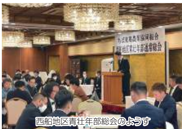
西船地区青壮年部総会のようす