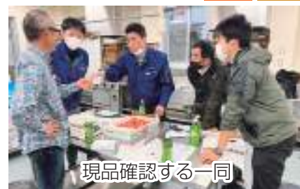
現品確認する一同