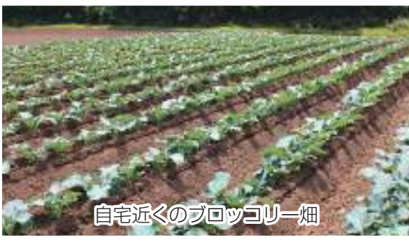
自宅近くのブロッコリー畑