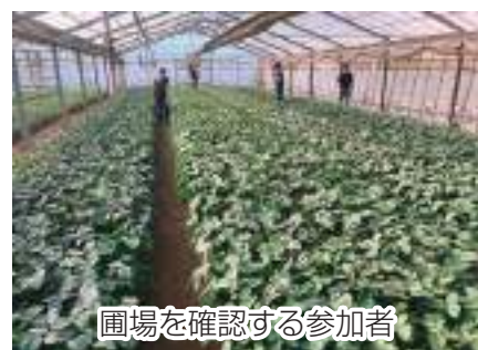
圃場を確認する参加者

印内出荷組合は5月9日、枝豆の査定会を印内八坂神社（船橋市）で行い、生産者15名が参加しました。