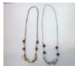
綺麗に仕上がりました