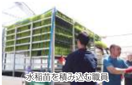
水稻苗を積み込む職員

田植えシーズンを迎えた4月23日から5月12日にかけて、野田市内の当JA水稻育苗センターで水稻苗の出荷を行いました。今年は、生産者90名・約1万1千枚が出荷されました。