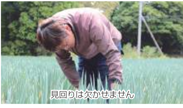
見回りは欠かせません