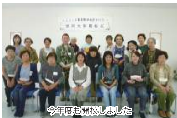
今年度も開校しました

野田地区女性部は4月28日、野田地区多目的ホール会議室で第36期女性部短期大学の開校式と第1回講座を行い、19名が参加しました。