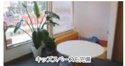
キッズスペースも完備

【住 所】 野田市岩名1059-9 【電話番号】 04-7124-5757 【定 休 日】 日曜・祝日 土曜日不定期、大型連休 【営業時間】 9:00 ~ 18:00