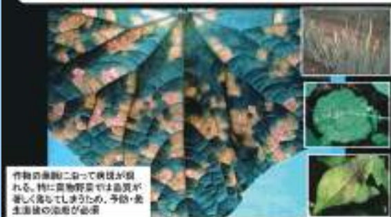
作物の葉面に沿って病斑が現れる。特に葉物野菜では品質が著しく落ちてしまうため、予防・発生抑制の対策が必要