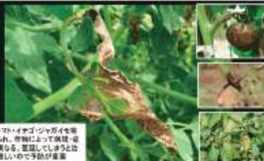
特にトマト・イチゴ・ジャガイモ等に発症し、作物によって病斑・症状は異なる。蔓延してしまうと被害は速いので予防が重要