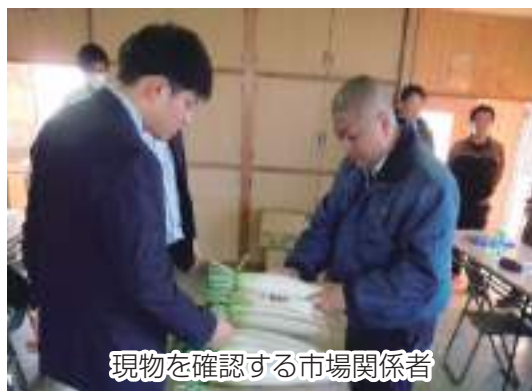
現物を確認する市場関係者