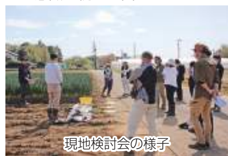
現地検討会の様子

まずJA全農ちばから情勢報告がされたあと、参加者全員で出荷規格と出荷時の留意点等を再確認しました。その後の現品査定では出荷規格表を基に、市場関係者と品質などを協議しながら出荷に向けた意識の統一を図りました。