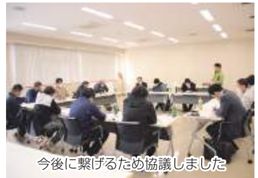
今後につなげるため協議しました

米の消費が減少傾向になるなか、生産者の安定した収入に繋がるよう今後も協議を続けてまいります。