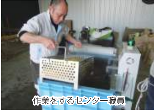
作業をするセンター職員

当JAでは3月11～15日にかけて、関宿支店・野田地区経済センター・東部地区経済センターで水稻種籾の温湯消毒を行いました。