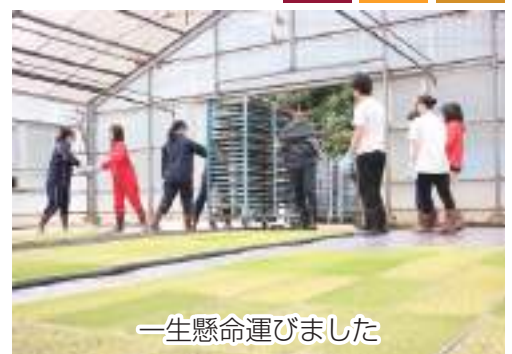
一生懸命運びました