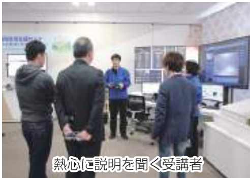
熱心に説明を聞く受講者

当JAは4月2日、第1期協同組合講座(第四回)を開き、受講生12名が参加しました。