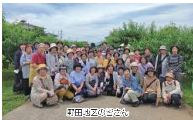
野田地区の皆さん