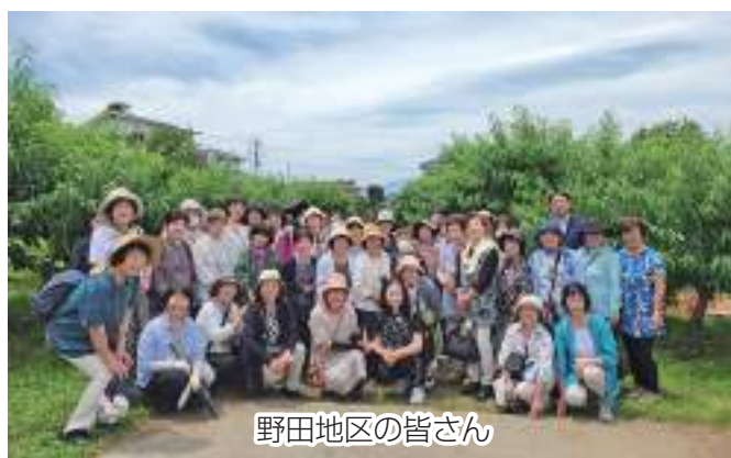
野田地区の皆さん