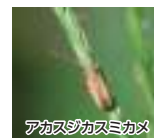
アカスジカスミカメ