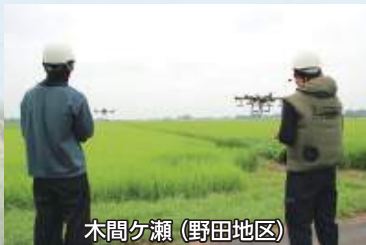
木間ヶ瀬 (野田地区)