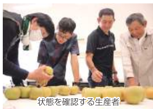
状態を確認する生産者

7月25日、本格出荷を前にJA ちば東葛栄農会果樹組合が東部支店会議室で幸水の出荷査定会を行いました。