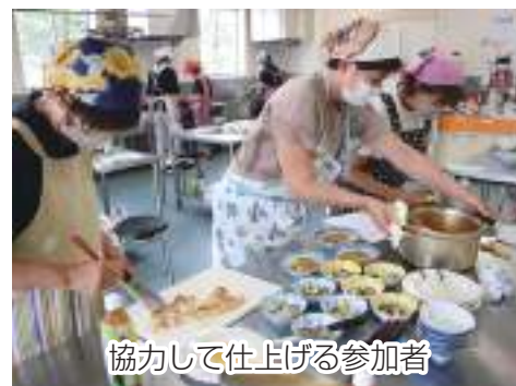
協力して仕上げる参加者

参加者からも「初めて参加したけれど、とても楽しかった」「ズッキーニがマリネや和え物になるなんて知らなかった」と感想が聞こえ、新しい発見や交流の場となりました。