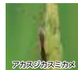
アカスジカスミカメ