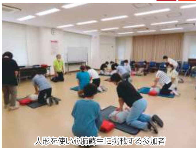
人形を使い心肺蘇生に挑戦する参加者

参加者はそれぞれの役割に意味があることを再確認し、緊張感をもって真剣に取り組みました。