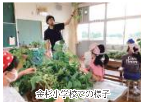
金杉小学校での様子

児童から「枝豆の品種は何種類ですか?」「農家をしていて良かったことは何ですか?」などたくさんの質問が投げかけられ、相互交流が活発な授業となりました。