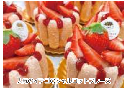
人気のイチゴのシャルロットフレーズ

今後はケーキ以外にも季節に合わせた焼き菓子のギフトにも力を入れていくそうなので、お土産にご家族やご自身用に、ル・ミュウさんの魅力を味わってみてはいかがでしょうか。