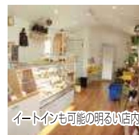
イトインも可能な明るく店内

【住 所】 野田市木野崎1646-47 【電話番号】 04-7199-2921 【定休日】 水・木曜日、その他不定休 【営業時間】 11:00～18:00