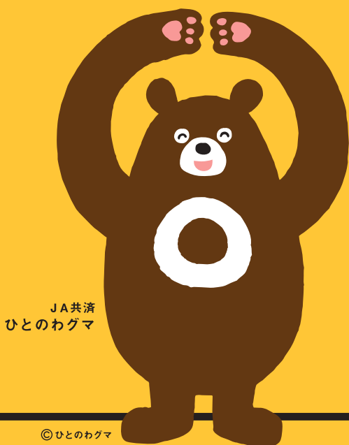
JA共済 ひとのわぐま

お客様の大切な現金等重要物をお預かりする際は、 受取書・領収書等 を 必ずお渡ししております。