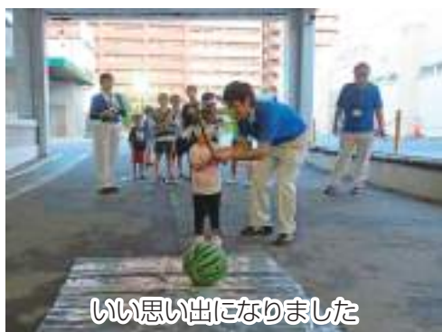
いい思い出になりました

西船地区は8月20日、同地区の若手生産者同士やその家族、JA職員との交流を目的にバーベキュー大会を行いました。