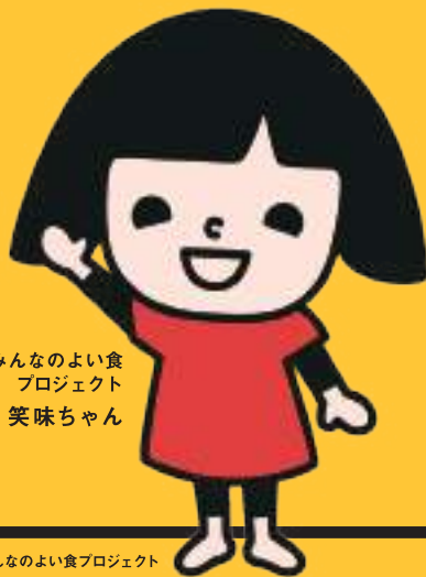
みんなのよい食 プロジェクト 笑味ちゃん