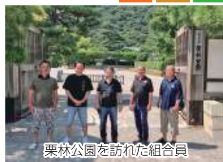
栗林公園を訪れた組合員

香川県へ移動したあとは、特別名勝の一つ「栗林(りつりん)公園」を見学。約75ha(総面積)もの広大な敷地には、文化・芸術的な歴史的背景を感じながら四季折々の変化が楽しめる庭園が広がっていました。参加者はそれぞれ新たな気づきを得る視察となりました。