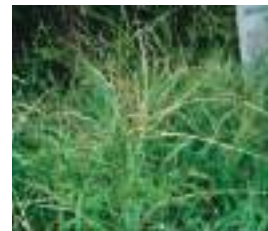
代表的なイネ科雑草