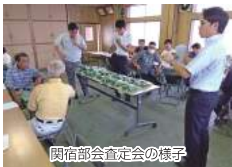
関宿部会査定会の様子

JA ちば東葛予冷部関宿部会とJA ちば東葛予冷部会は、ほうれん草と春菊の出荷に合わせ、市場関係者、JA 全農ちば、東葛飾農業事務所を交えて査定会を行いました。