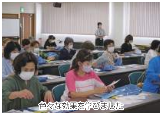
色々な効果を学びました

JAちば東葛柏地区女性部は8月28日、柏支店会議室で講習会を開催し26名が参加しました。