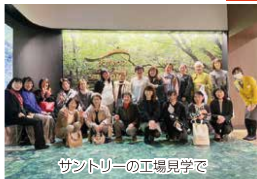
サントリーの工場見学で

一行はその後、よみうりランド遊園地へ移動し、この時期にしか見られないイルミネーションを楽しみました。