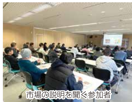
市場の説明を聞く参加者

参加者は、風土が異なる地域を訪れてその歴史と背景について学び、そこに住まう人と農・商・工の結びつきと、自身の地域について考える視察となりました。