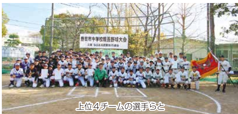
上位4チームの選手らと

11月30日、12月7日の2日間、当JA主催「第5回野田市中学校親善野球大会」を野田市内で開催しました。