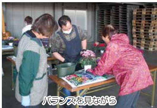
バランスを見ながら

JA ちば東葛柏地区女性部は12月3日、ガーデニング講習会を開催し29名が参加しました。