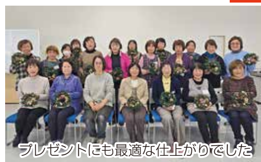
プレゼントにも最適な仕上がりでした

今回はお揃いのデザインに挑戦しましたが、少しずつ異なる雰囲気の作品を手に、それぞれ感想を伝え合いました。