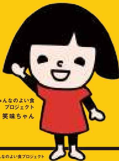
みんなのよい食 プロジェクト 笑味ちゃん