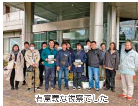
有意義な視察でした

施設見学の途中に小松菜の試験栽培をするほ場を回るなど、同組合にもとても密接に関係する研究もあり、参加者は興味深く説明を聞いていました。