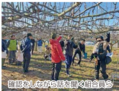
確認をしながら話を聞く組合員ら