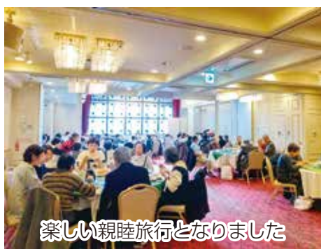
楽しい親睦旅行となりました

JAちば東葛柏・我孫子地区年金友の会は11月27日、72名が参加して日帰り親睦旅行を行いました。